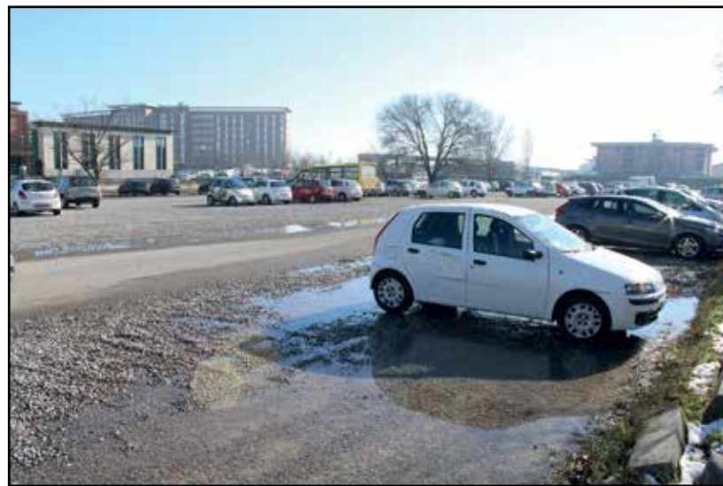
La situazione del parcheggio esterno dell'Ospedale mentre in quello interno "fioccano" le multe.

Il parcheggio ASL-Ospedale è, ormai, una leggenda. In negativo. Documentata dalle infinite lamentele ai vari giornali locali e provinciali. Qualcosa, di volonteroso, è stato fatto. Non basta. L'ideale sarebbe un parcheggio come "Dio comanda". Ma se aspet-