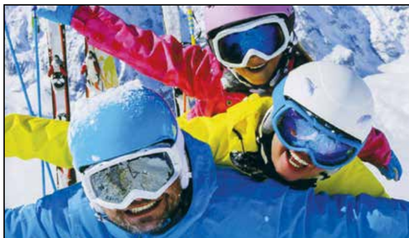
Felicità e divertimento sulla neve.

Infine altre 2 uscite: il 7/8 Marzo il week-end da decidere assieme a Voi e il 22 Marzo l'ultimo spot da stabilire coi Vostri suggerimenti. Non dimenticate di seguire gli aggiornamenti sulle gite sul nostro sito www.sciclubcarpenedolo.it ma in particolare, Vi ter-