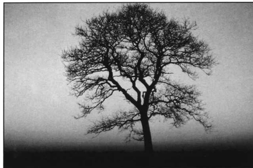
Un albero solo, con la sua singolarità, spoglio, può ben assumersi a simbolo del silenzio. La fotografia di questa quercia è inserita nel bel libro Contemplazione sotto gli alberi (Ed. Morcelliana, Brescia 2002), meditazioni di Romano Guardini, un grande maestro per quanto riguarda l'esercizio ascetico del silenzio.

Allora il silenzio, oltre che presupposto per la capacità di ascolto, diventa anche "la qualità della parola", lo spessore