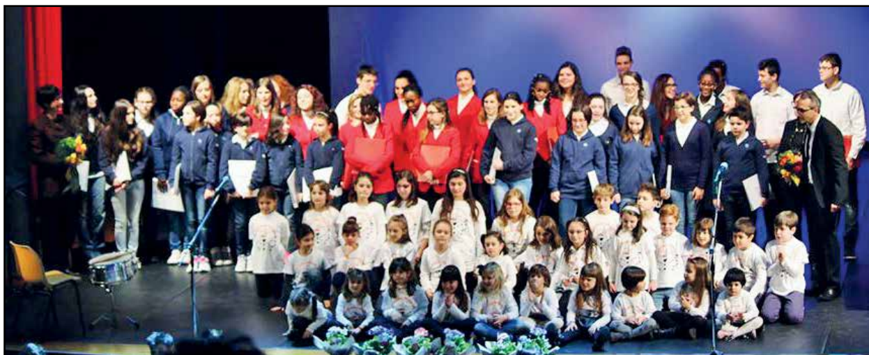
L'esibizione di bambini e ragazzi sul palco del Cinema Teatro Gloria.

Il 17 Gennaio presso il Cinema Teatro Gloria di Montichiari si è tenuto il concerto "Canzoni e Sorrisi di Speranza" organizzato dal coro di voci bianche FACCIAMO MUSICA che ha sede ai Novagli, frazione di Montichiari. Beneficiaria di questo evento la nostra Associazione Un Sorriso di Speranza ONLUS.